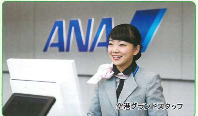
空港グランドスタッフ