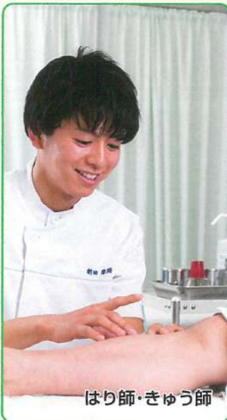
はり師・きゅう師