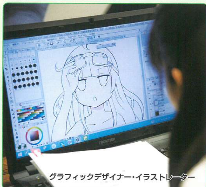
グラフィックデザイナー・イラストレーター