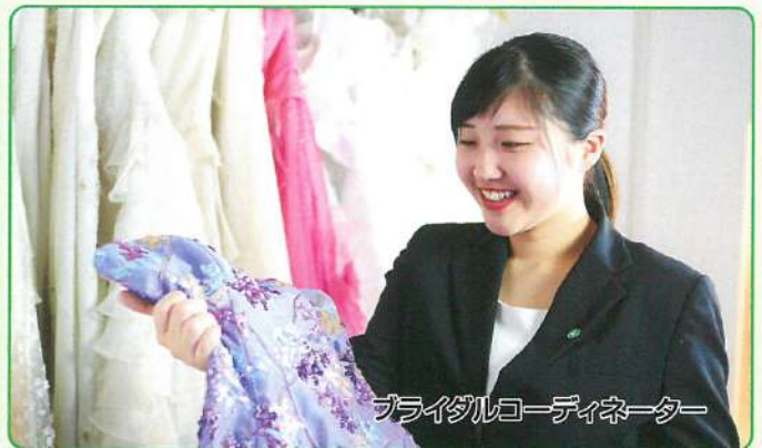
ブライダルコーディネーター