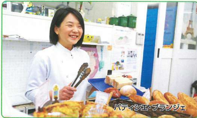
パティシエ・ブランジェ

各職業のプロが分かりやすくその職業の内容や魅力、将来性、なるためのルートを説明します。その職業を分かりやすく体験することもできます。