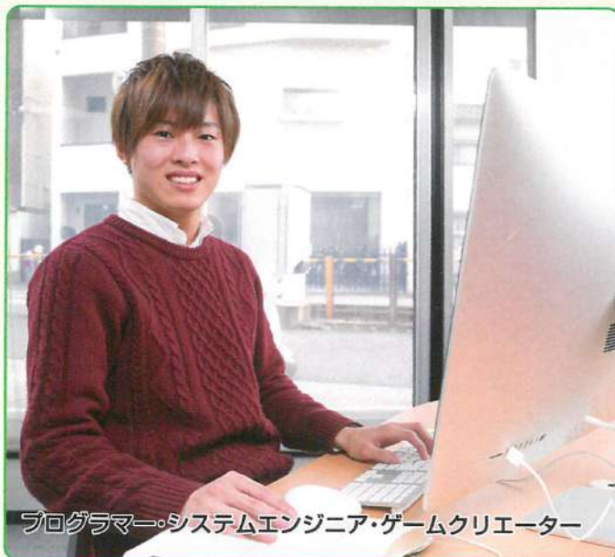
プログラマー・システムエンジニア・ゲームクリエイター

各職業のプロが分かりやすくその職業の内容や魅力、将来性、なるためのルートを説明します。 その職業を分かりやすく体験することもできます。