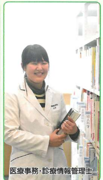
医療事務・診療情報管理士