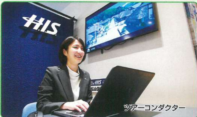
ツアーコンダクター