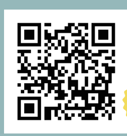
予約はHPから受付中